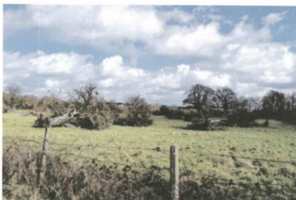
Ceci n'est pas le résultat d'une tempête récente. Ce spectacle désolant est visible en arrivant de Crulai depuis la tempête de 1999 !

Puisque rien n'a changé, Jean Sellier est toujours autant en colère contre ces nuisances. « Nous ne sommes toujours pas débarrassés des dépôts de voitures et de détritus qui nuisent à l'attractivité