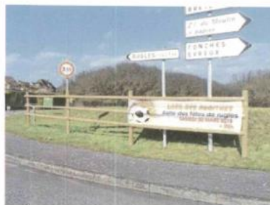
Pour lutter contre l'anarchie des banderoles autour des giratoires, la Cdc pourrait suivre cet exemple de Rugles